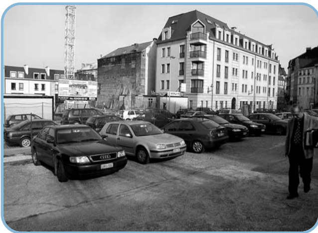
Rue de Dinant : Le plus grand parking à ciel ouvert du centre historique.