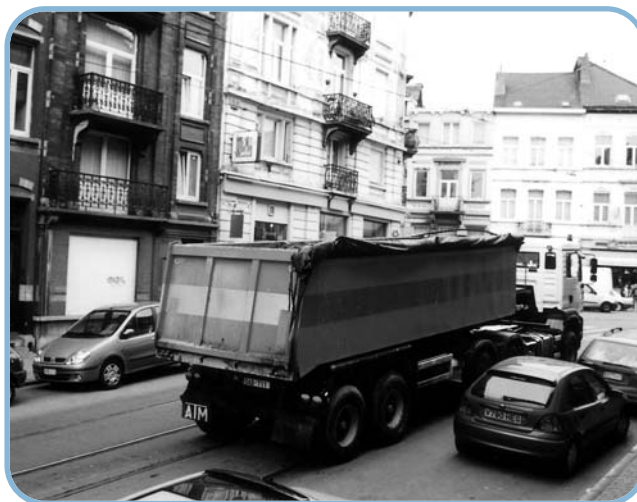
L'une des causes du bruit routier: le démarrage en pente des poids lourds (ici au carrefour de l'avenue de la Couronne).

Le poids lourd reste également un encombrant sujet pour les communes à défaut d'un plan général de déplacement et d'un plan de transbordement aux entrées principales de la région.