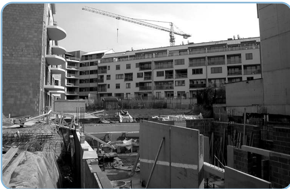
Un partenariat d'opérateurs privés et publics a restructuré le site de la Caserne Dailly en le réaffectant pour le logement.

[19] Le principe est le suivant : les travaux d'aménagement et de rénovation sont réalisés par le privé « tiers investisseur » qui se rembourse au fur et à mesure sur les économies d'énergie réalisées. La charge et la responsabilité du projet incombent au tiers. Le remboursement des frais par la commune dépend du bénéfice réalisé sur la facture d'énergie.