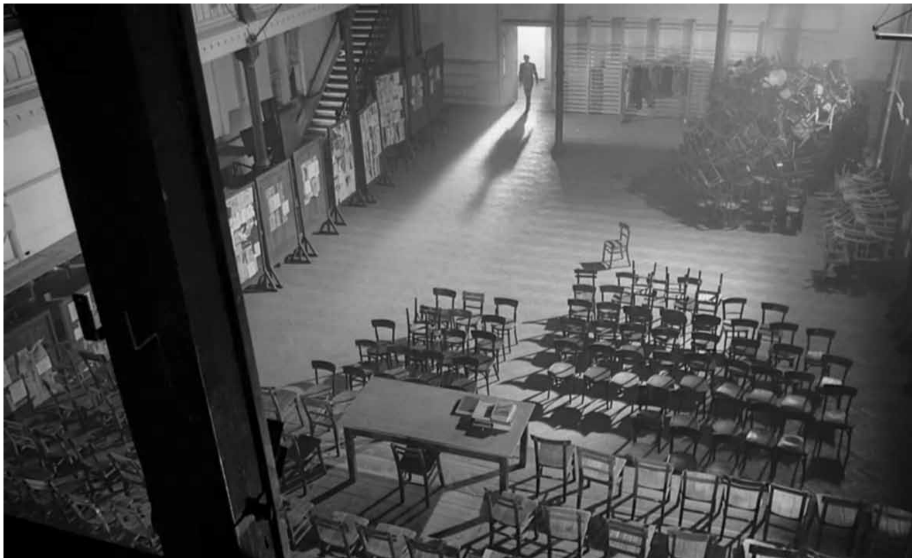
LE PROCÈS D'ORSON WELLES (D'APRÈS KAFKA) - 1962