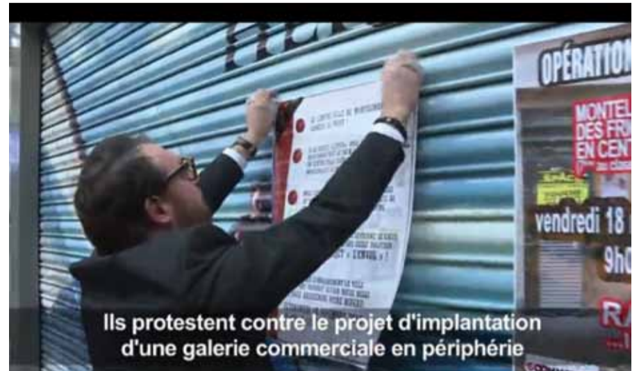
Ils protestent contre le projet d'implantation d'une galerie commerciale en périphérie

http://multinationales.org/La-Cour-penale-internationale-elargit-son-mandat-aux-crimes-environnementaux-et